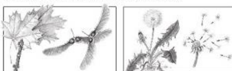
Клён и его плоды

Как распространяются плоды этих растений? Допиши ответ. Обведи на рисунке те части плодов, которые помогают им распространяться таким способом.